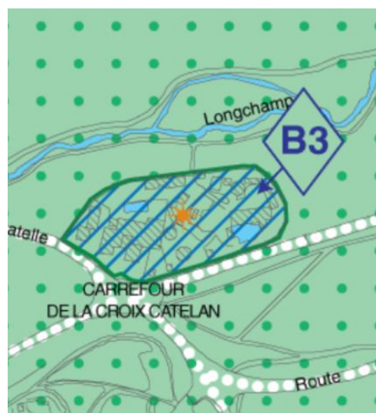
Exemple de STCAL « projet »

STCAL « projet » : Dans certains STCAL, dit « STCAL Projet », les droits à construire s'exprime différemment :